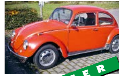
VW Käfer 1200 ...mettime, 6.1970, 127km, ...H-Kennz., alles original, 6...wetterferreinigungsanlage, Nebelscheinwerfer, Skisack, guter Zustand, X.XXX,- Euro , Tel. 00000-000000.

Fließtext- / Fotoanzeigen: 5-zeiliger Eintrag (pro Zeile ca. 40 Zeichen*) * incl. Satzzeichen und Zwischenräume - Veröffentlichung nur gegen Vorkasse